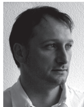
Nils Kretzer CD battery.communication