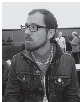
Florian Ludwig CD Text Kolle Rebbe