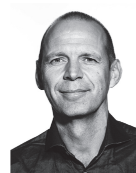
Oliver Hack GF Filmproduktion Markenfilm