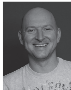
Bernd T. Hoefflin GF element e filmproduktion