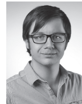
Benjamin Bruno CD Copy Jung von Matt/next