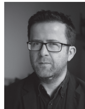
Will Rolls Creative Agency Partner DACH Facebook Germany